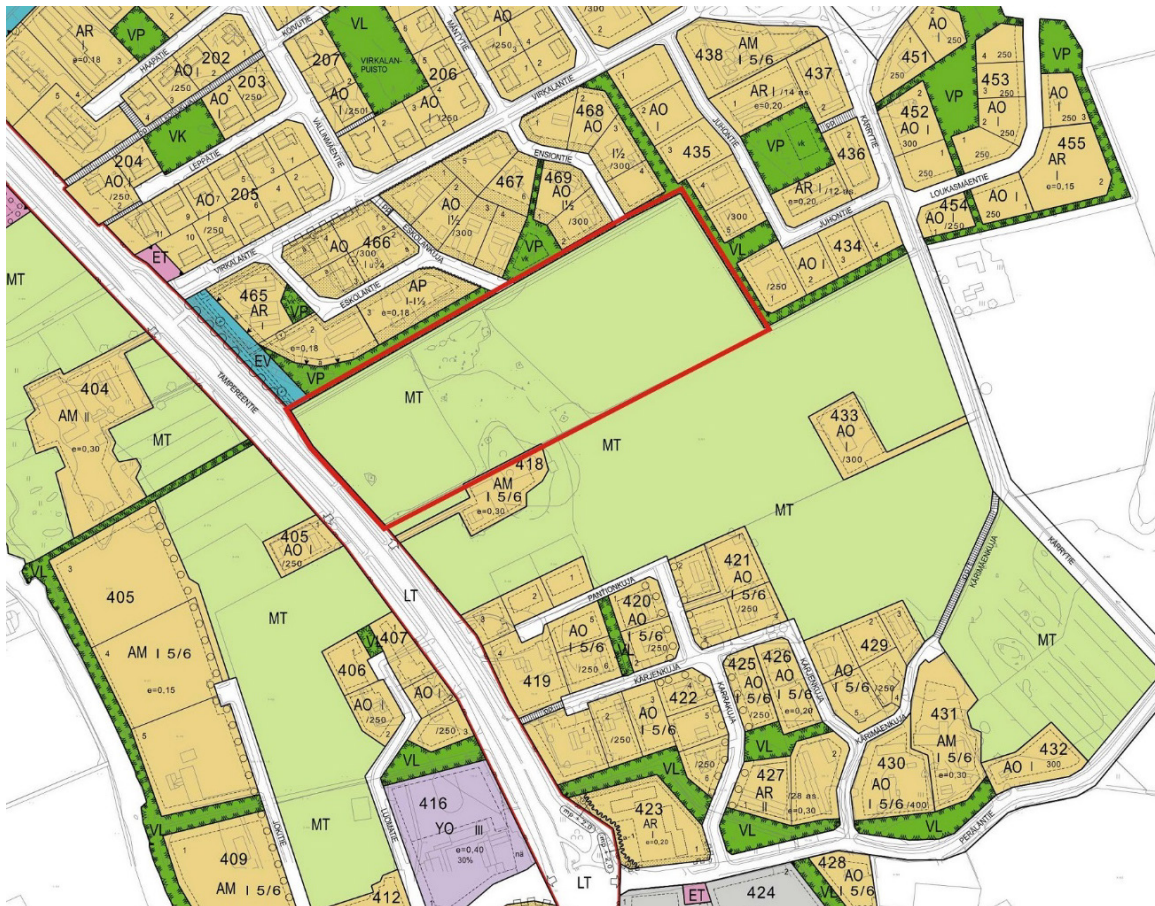
Kuva 2. Ote asemakaavayhdistelmästä. Suunnittelualan rajaus punaisella.