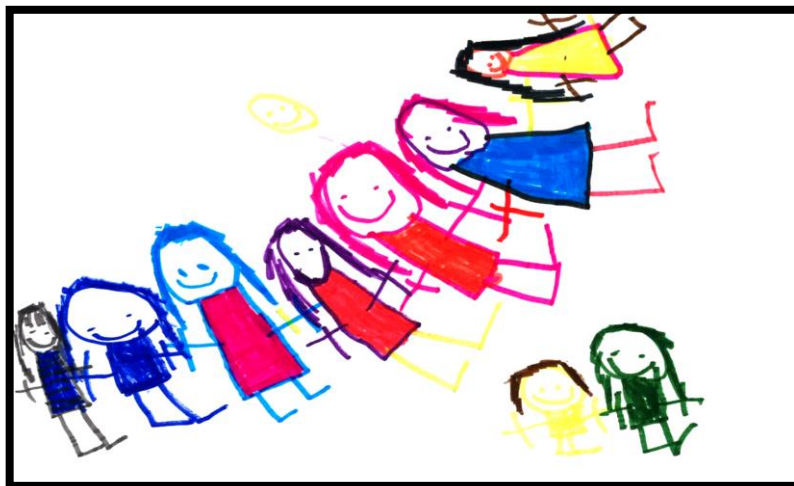
"Taiteilijana tyttö 5v."

Huoltajille suunnitelma on nähtävänä sähköisessä muodossa kunnan internet-sivuilla ja heidän on mahdollista kommentoida suunnitelmaa ja antaa palautetta esimerkiksi tyytyväisyyskyselyn sekä vanhempainillan yhteydessä.